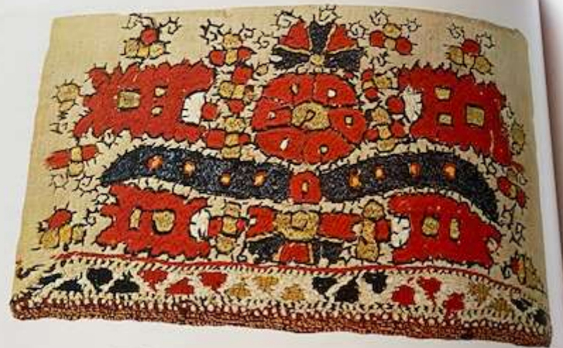
Άσπρη γαλή με κόκκινα μπρόδια κεντημένη με μετόξι (Μουσείο Μνησίου)