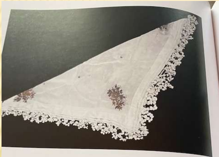
Γαλή κεντημένη γάζα